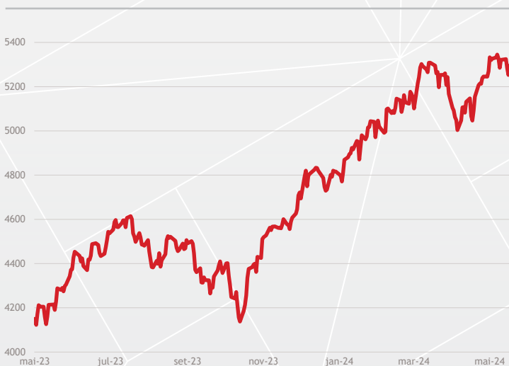
ÍNDICE S&P 500

Na elaboração de nossas teses de investimentos, consideramos que a maior parte dos países desenvolvidos está caminhando para iniciar um ciclo de queda de juros devido a índices de inflação já próximos às metas e ao atual nível de juros que está em território restritivo. A eventual ressurgência de elevados reajustes dos preços ao consumidor e dos salários segue como principal variável a ser monitorada, uma vez que o combate à inflação continua sendo a prioridade dos bancos centrais. Seguimos muito atentos também aos dados de atividade corrente, em